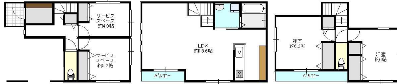
A. B号棟1F (42.85㎡) A. B号棟2F (39.95㎡) A. B号棟3F (28.77㎡)