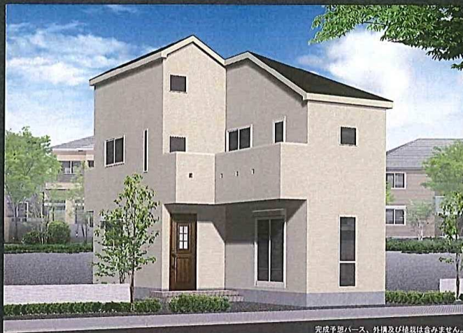
完成予想パース、外構及び植栽は含みません。