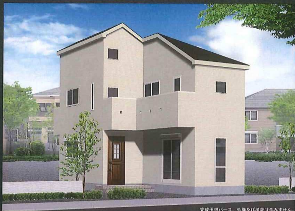
完成予想パース、外構及び植栽は含みません。