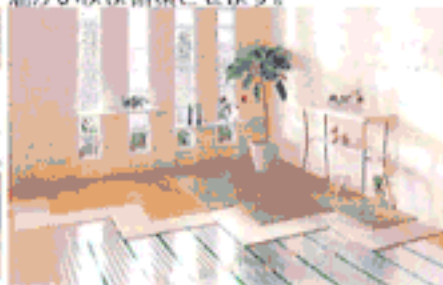
カーペット&タイル